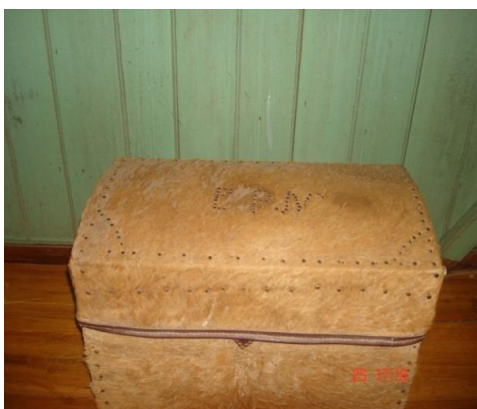
Figura 3 - Canastra