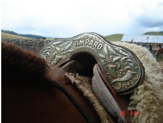
Figura 17 - Cela